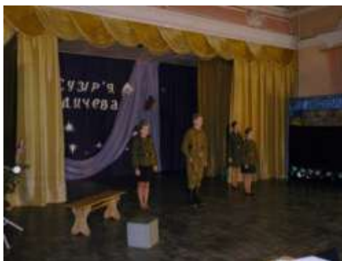
Фото 1.1.1. Міський конкурс дитячої творчості «Сузір'я Бердичева»

Метою конкурсу є виявлення талановитих учнів та активізація їх творчої діяльності. На конкурсі ми бачимо дитину, обдаровану в конкретному виді мистецтва – вокалі, хореографії, акторській творчості. І саме наш заклад є осередком «сконцентрованої» роботи з такими дітьми, більшість з яких здатні до вибору мистецької професії і успішності в ній. Як результат конкурсу – вплив мистецтва на особистість – значно посилюється, тому що учасники активно спілкуються один з одним, аналізують власну творчість, дискутують, діляться враженнями щодо конкретної мистецької діяльності. Спілкування є результатом усвідомлення дитиною спроможності творити простір в рівноправному діалозі з іншими його членами: митцями, педагогами, батьками, школярами з інших навчальних закладів. У такий спосіб виховується потреба і здатність самому впливати на простір, творити його ( відео - додаток 1 за посиланням https://www.youtube.com/watch?v=h5ibl-r158U ).