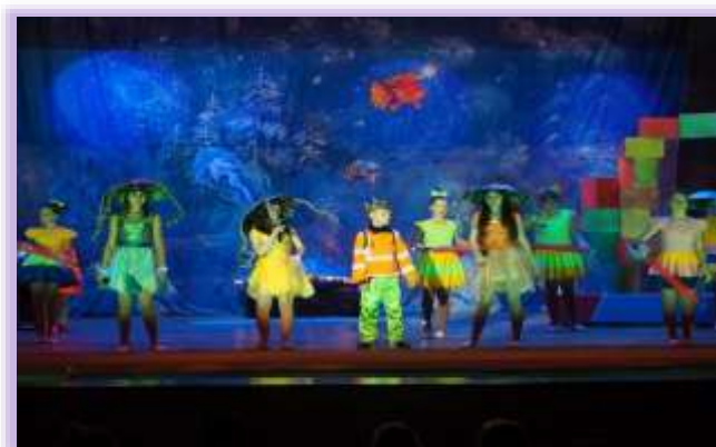
Фото 1.2.1. Новорічні вистави «Пригоди у замку чарівних пікселів» і «Чарівний годинничок».