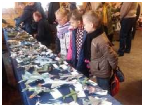
фото 1.2.2. Бердичівська відкрита міжрегіональна виставка «Історико-технічне стендове моделювання»